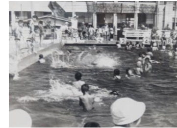
道路南側にあったプール