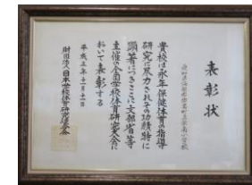
「体力づくり」で文科省表彰