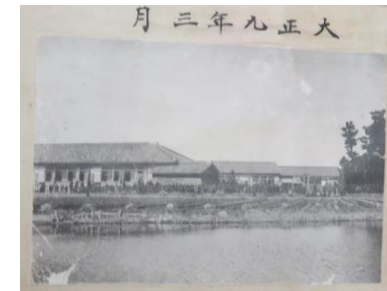
大正9年の頃の校舎