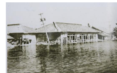
伊勢湾台風で被害が出た校舎