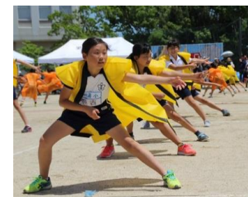
全校で踊る「栄南ソーラン」