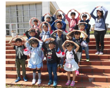
海南こどもの国へスマイル遠足